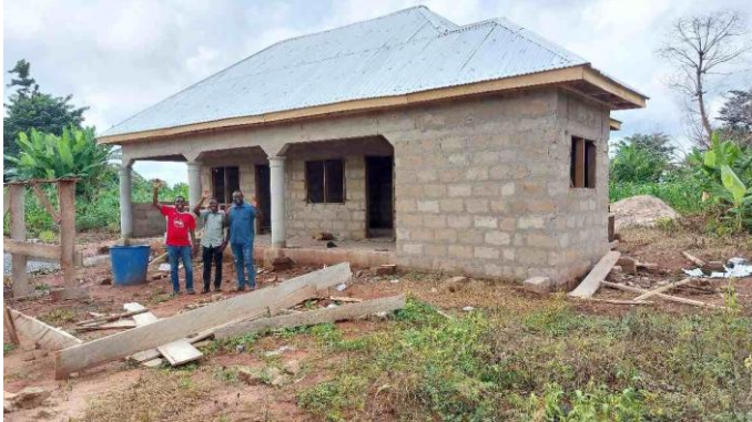
De nieuwe DC in aanbouw

In het dorp Kyeradeso in het Nkoranza-South District bouwen wij momenteel een prachtige nieuwe Daycare, als vervanging voor het tijdelijke en te kleine onderkomen in een oud klaslokaal.