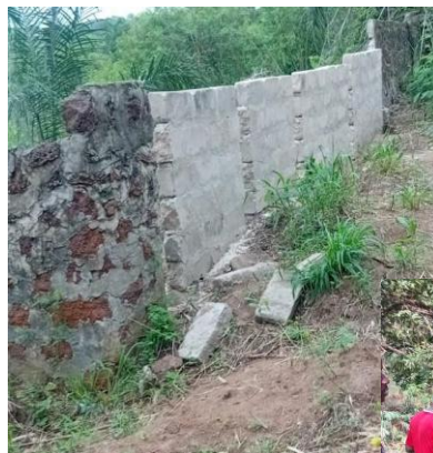
De slechte conditie van de muur rondom PCC

https://www.instagram.com/operationhandinhand/