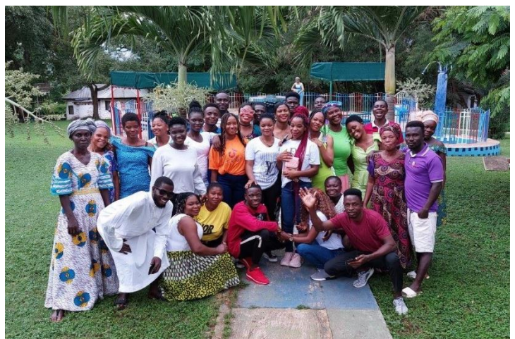
29 September was 8 e Caregivers dag