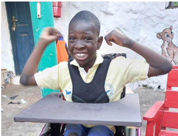
Patience helemaal blij in haar rolstoel

Binnenkort meer hierover in de rubriek Alberts Corner op onze website.