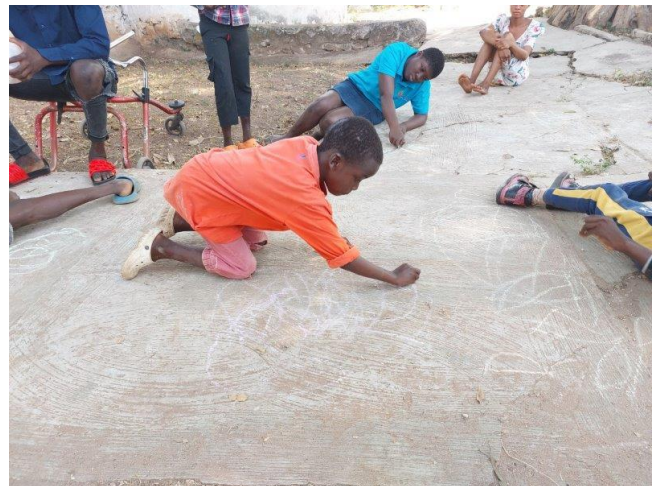
Paden in PCC zijn er ook voor stoepkrijten!