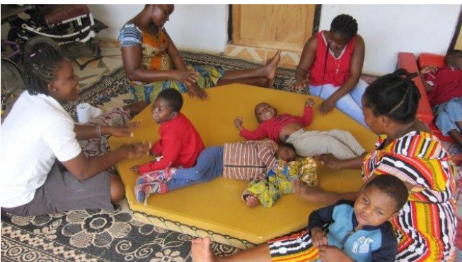
Deel van het PCC dagprogramma

Ook de G8 groep uit Groningen, die in oktober zou meehelpen met de realisatie van een nieuw gebouw voor de ouder wordende kinderen van PCC, kon door corona helaas niet naar Ghana reizen. Jammer voor hen en zeker ook voor ons! Wij hopen hen nu in 2021 alsnog te kunnen verwelkomen. Het zijn tenslotte oude en vertrouwde vrienden van PCC!