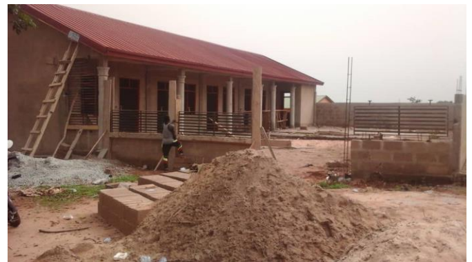
Het nieuwe daycare gebouw in Nkoranza

Voor het jaar 2020 plannen wij een paar belangrijke ontwikkelingen, sommige daarvan zijn zelfs al volop in uitvoering. Wellicht de belangrijkste is de realisatie van een prachtig gebouw voor Daycare in het centrum van Nkoranza, waar ouders van een kind met een beperking uit Nkoranza binnenkort elke werkdag hun kind naar toe kunnen brengen.